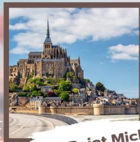
Mont Saint Michel