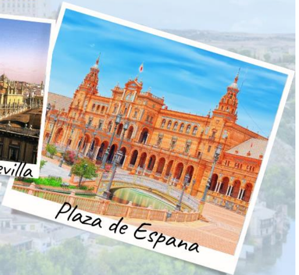
Plaza de Espana