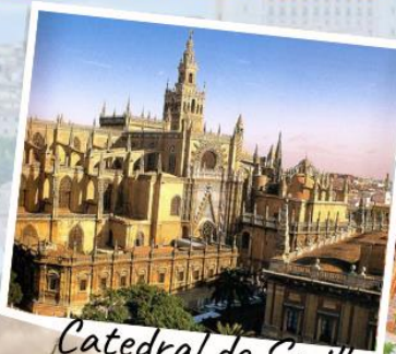
Catedral de Sevilla