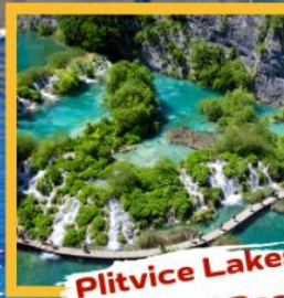
Plitvice Lakes National Park