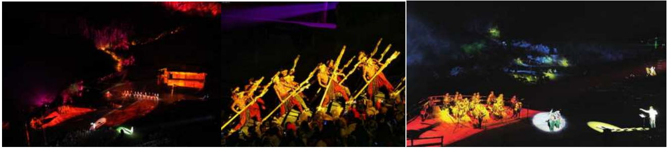
ที่พัค : หรือระดับเทียบเท่า

DAY 3 : อุทยานเขานางฟ้า - อุ๋หลง - จงซิ่ง - หงหยาดัง - ล่องเรือยามค่ำคืน - ถนนคนเดินเจียฟางเปย