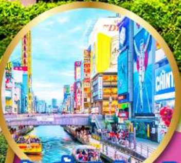
ช้อปปิ้งชินไซบาชิ