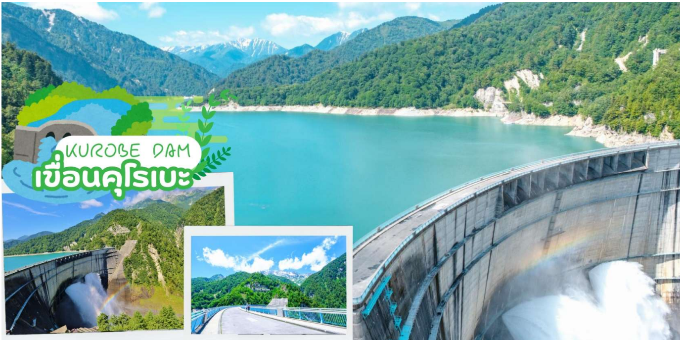
KUROBE DAM เขื่อนคุโรเบะ