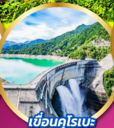
เขื่อนคุโรเบะ