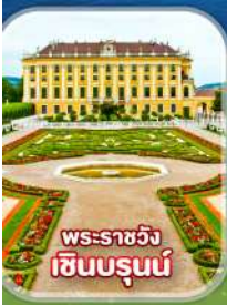
พระราชวัง เซินบรุนน์