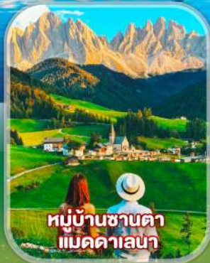
หมู่บ้านซานคา แม็คดาลเลน่า