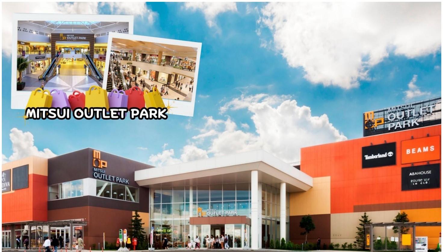
กลางวัน อีสรระอาหารกลางวันตามอัยาศัย ณ MITSUI OUTLET PARK SAPPORO